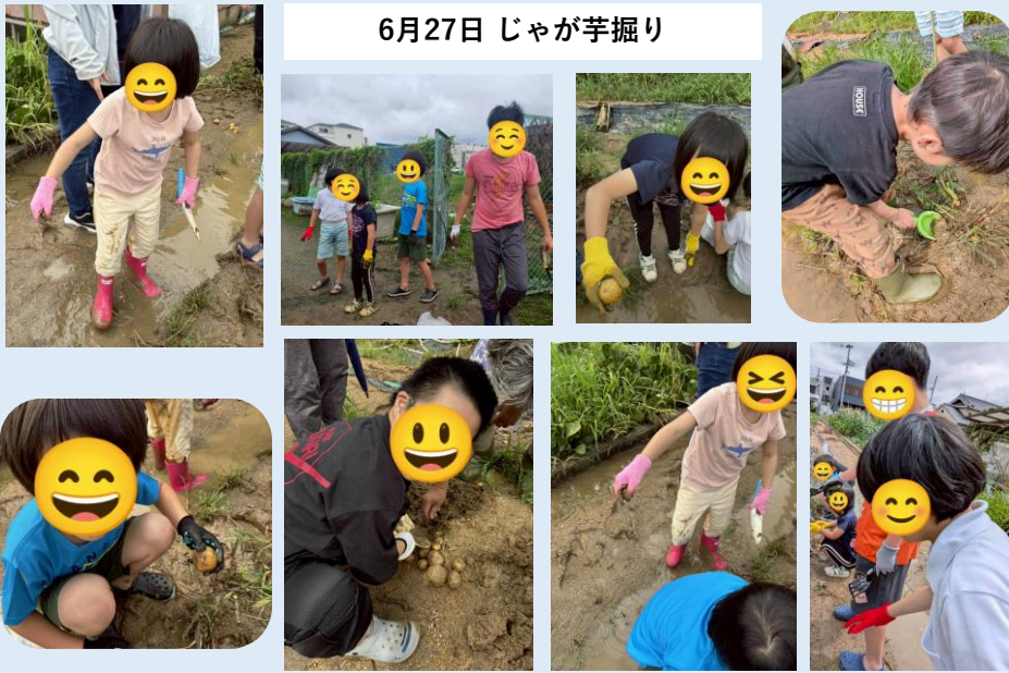
6月27日 ジャガイロ掘り