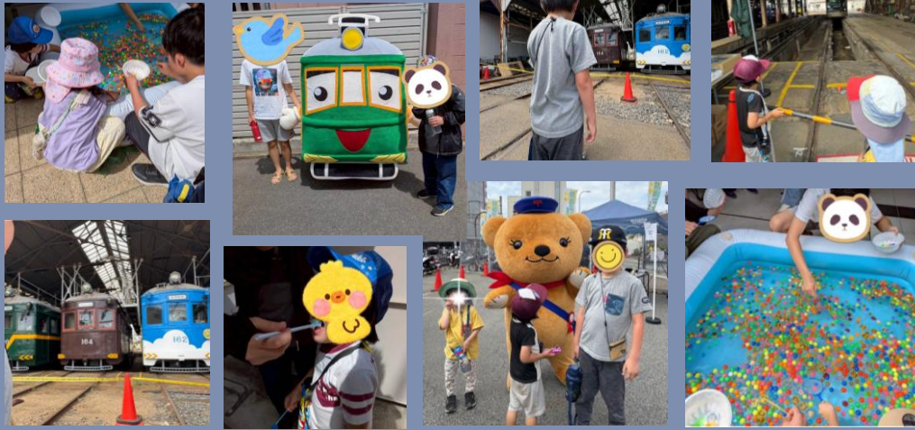
6月6日 路面電車祭り